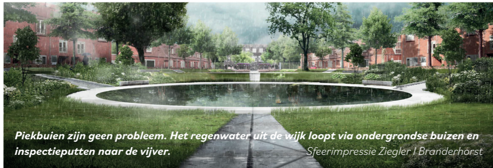
Piekbuien zijn geen probleem. Het regenwater uit de wijk loopt via ondergrondse buizen en inspectieputten naar de vijver. Sfeerimpressie Ziegler | Branderhorst